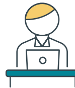
Aantal unieke gebruikers Negometrix per maand in 2020

Het aantal unieke gebruikers dat per maand inlogt, is sinds de uitbraak alleen maar toegenomen. Zowel in vergelijking met vorige maand, als dezelfde periode vorig jaar.